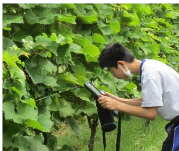
2.6月のブドウの木のすがたを予想しよう。